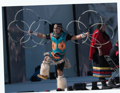
Un danseur autochtone au Mémorial national du Canada à Vimy.

Au Canada, nous avons la chance de vivre dans une société composée de cultures remarquables. Celles-ci incluent évidemment les Premières Nations, les Inuits et les Métis, dont les racines sont ancrées dans notre pays depuis des milliers d'années. Nombreux sont les hommes et les femmes autochtones ayant eu le courage de servir dans l'armée