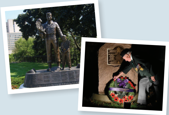
Haut : Monument honorant les Canadiens morts en service à Ottawa.