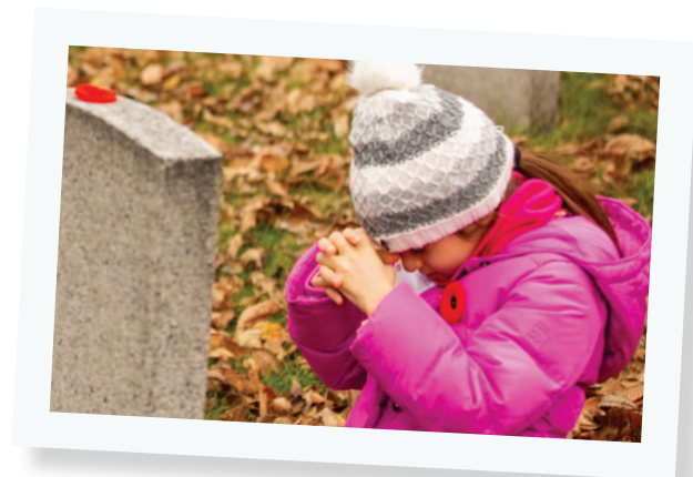
Cérémonie du Souvenir au cimetière Beechmount à Edmonton en 2019.

Les ours comme moi sont grands et forts, mais voir de jeunes élèves déposer des coquelicots m'a profondément touchée. Cette année, pourquoi ne pas demander à ton enseignant d'y participer et tu pourrais toi aussi donner un coup de main, pour aider à partager le souvenir dans ta communauté.