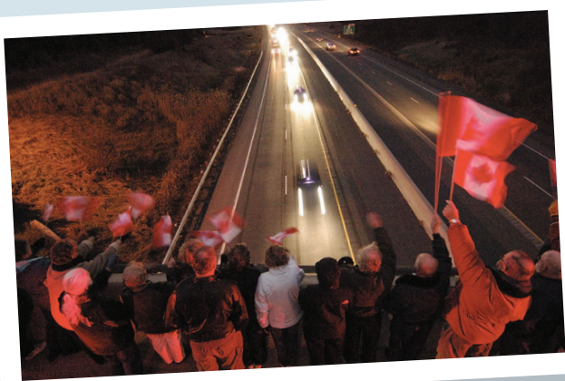
L'Autoroute des héros en novembre 2007.

Il y a tant de façons de se souvenir des Canadiens qui ont servi dans l'armée au fil des années. Je m'émerveille toujours des nombreux monuments qui se trouvent dans les villes et villages de