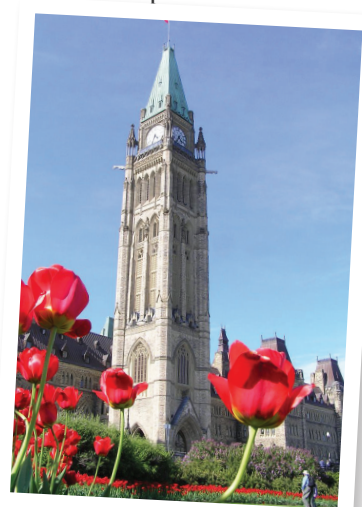
Tulipes en fleurs à la Colline du Parlement.

Canadiens sont morts lors des opérations de libération des Pays-Bas. Les Néerlandais n'ont jamais oublié ce sacrifice, et depuis, ils envoient chaque année au Canada des milliers de bulbes de tulipes en guise de remerciement coloré. Les tulipes fleurissent chaque printemps dans notre capitale, Ottawa!