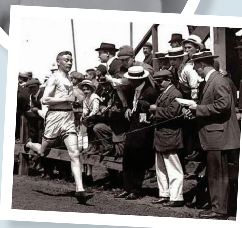
Bas : Alexander Decoteau gagne une course.