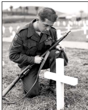
Près de la tombe d'un camarade – BAC PA-122813

Les conséquences de la guerre sont nombreuses et il n'y a pas de véritables gagnants.